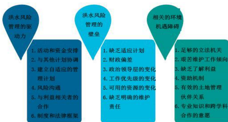
图 3 洪水风险管理实施的驱动力和壁垒

图 3 总结了实施洪水风险管理的障碍以及实现有效管理的推动因素。因为缺乏明确的政策、规划和实施角色和职责，许多很好的计划已经失败。例如，过去尝试在巴西的伊瓜苏河流域进行洪水管理，由于国家、区域和地方当局的意见未达成一致而失败。因此，识别特定的风险问题并尽快提供解决方案是成功实现洪水风险管理的一个至关重要的步骤。