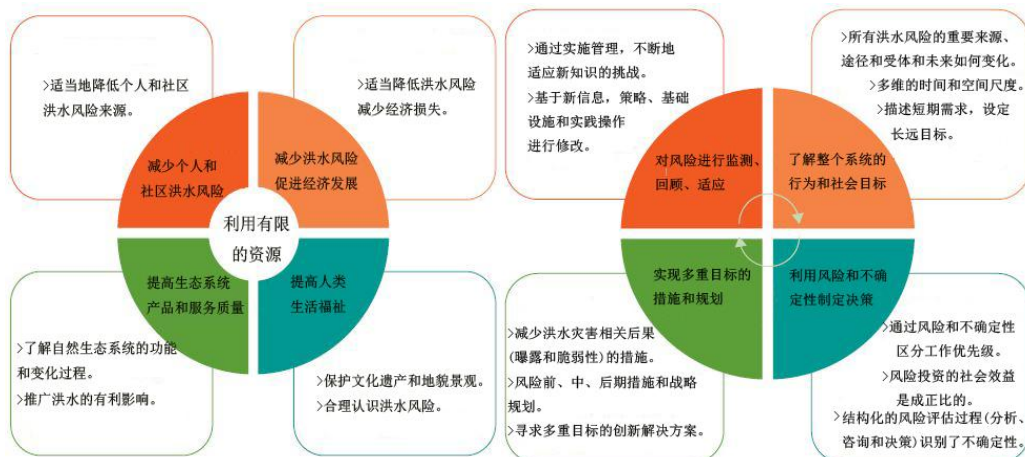
图1 洪水风险管理战略的主要目标

洪水风险管理具有多重时间和空间尺度目标（图1）。这些目标的实现依赖于合适的投资组合的制定和措施实施（优缺点补偿），由于洪水系统属性的不断变化，这一过程是复杂的（气候、地貌和社会经济影响）。洪水风险管理计划的制定和决策实施都要考虑未知的影响。因此，洪水风险管理是一个不断持续适应的过程，有别于传统的洪水防御方法。