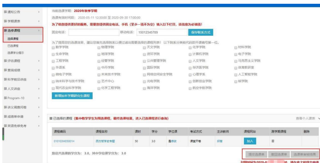
图 8 选课界面

2.选课方法：选课网址 http://sep.ucas.ac.cn/ 。首次登录系统时，用户名为学号，密码为身份证号（字母需大写）。登录后进入“选课系统”的“选修课程”模块选择课程，填写并保存联系方式后才可选择开课学院的相关课程，选课界面见图 8。