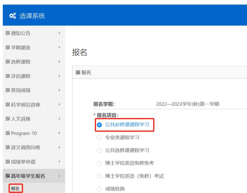
图 2 课程学习报名项目

第二步，进入“高年级学生报名”模块点击“报名”，在“报名项目”处根据自身需要点击“公共必修课课程学习”、“专业类课程学习”、“公共选修课课程学习”，见图 2。