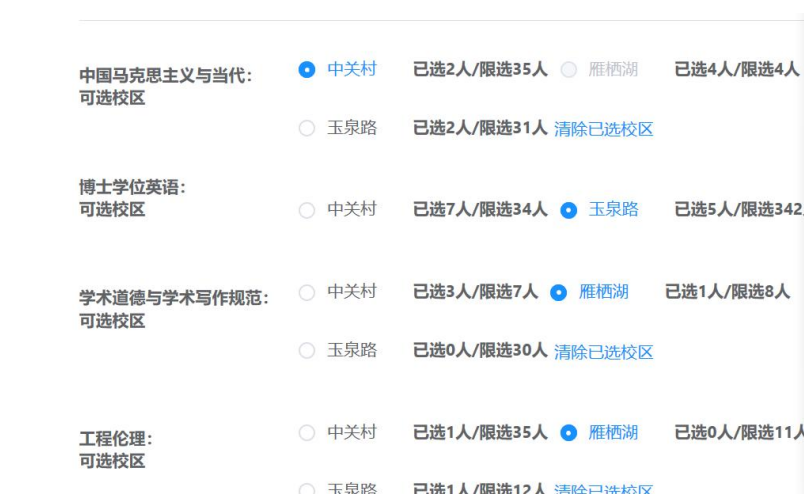
图 3 “公共必修课”课程报名

第三步，学生报名“公共必修课课程学习”项目时，须点击课程对应的校区，单击“点击报名”，即完成报名，见图 3。