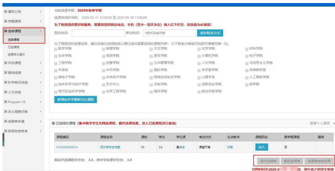
图 8 选课界面